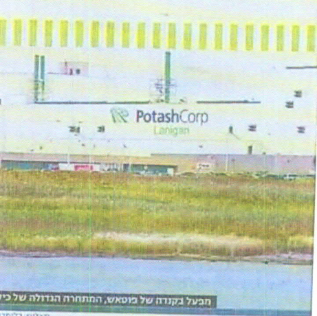
מבעל בקורה של מופסס, המתחרת הגדולה של כיל

הרווחיות של כיל בתחום המופססיום השתפרה בעקבות הזינוק במחירי המופסס: את תשעת החודשים הראשונים של 2011 היא סיימה עם מכירות של 1.34 מיליארד דולר ורווח של 192 מיליון דולר