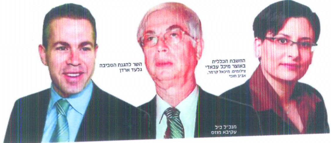
השר להגנת הסביבה גלעד ארדן

מימון כמעט מלא ותמלוגים כפולים עיקרי ההסכם החדש